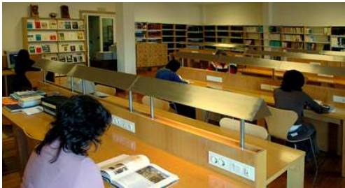
Biblioteca da Fundación Penzol